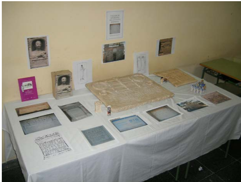
Figura 2. Exposición del Taller de epigrafía latina de Augusta Emerita

Las inscripciones se dividen en las que nos sirven para conocer las clases sociales (nº 1-3), las que nos muestran relaciones familiares (nº 4-7) y las que tratan de profesiones (8-9). En este último caso hemos incluido un epígrafe musivario.