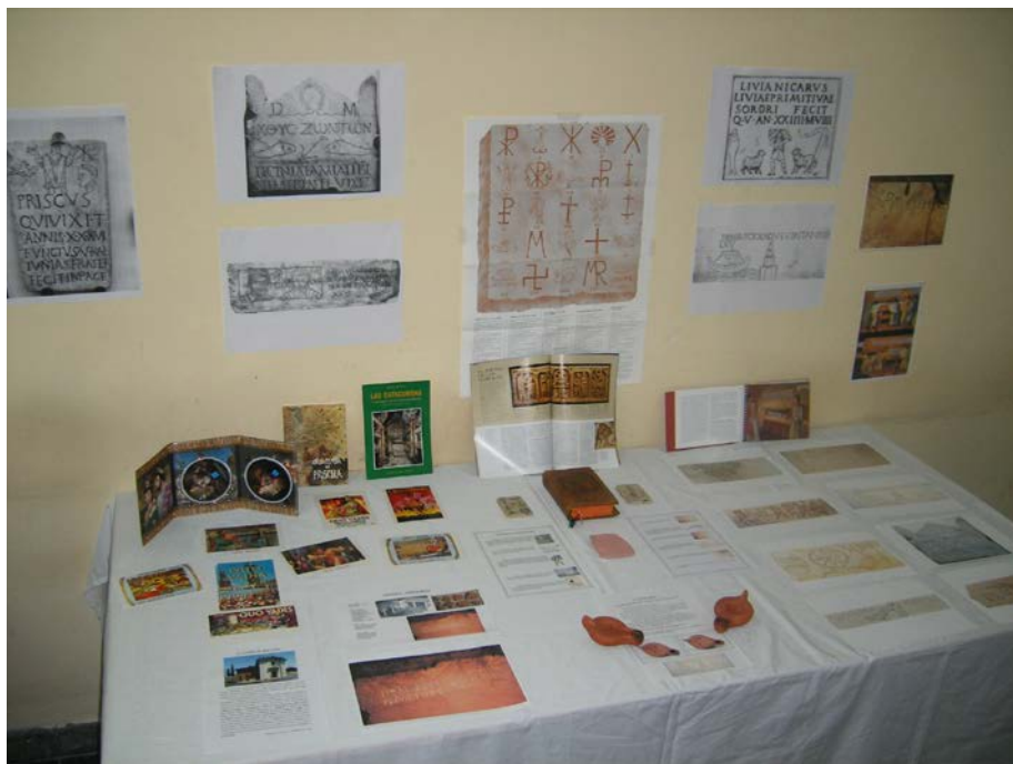
Figura 8. Exposición del Taller de epigrafía y símbolos paleocristianos

La traducción e interpretación de 25 ejemplos de Epigrafía Paleocristiana ocupa el grueso del taller. He dividido las inscripciones en I. Inscripciones sencillas, con ejemplos muy transparentes y asequibles; II. Inscripciones que reflejan el amor entre los familiares, con testimonios conmovedores del cariño y la fe los primeros cristianos; III. Epitafios de los diversos miembros de la comunidad cristiana y IV. Epitafios en lengua griega.