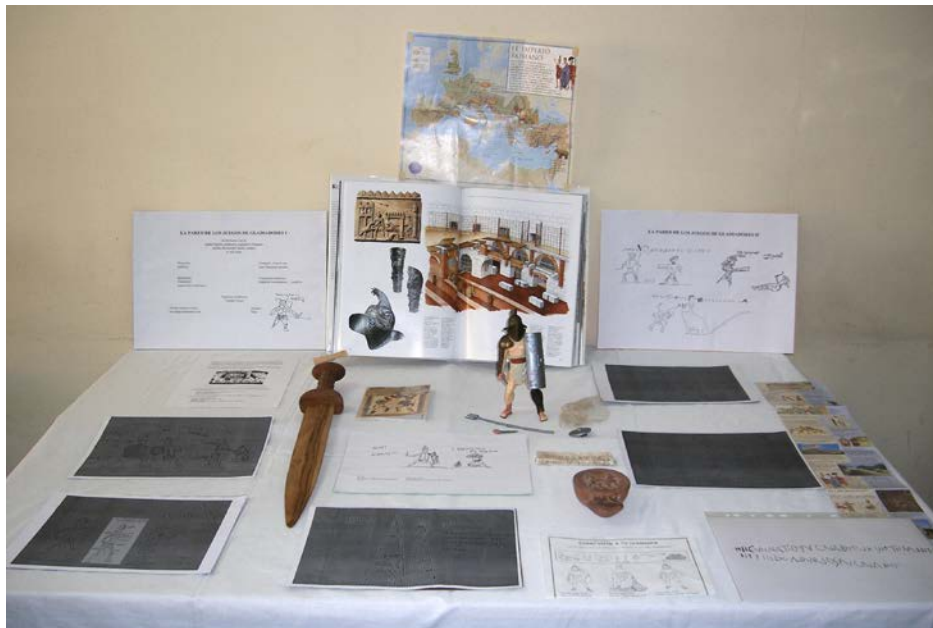
Figura 11. Exposición del Taller de grafitos de gladiadores

El trabajo con «La pared de las elecciones» (fig. 12) puede conectarse con algún periodo electoral que se produzca durante el curso. Igualmente puede usarse con algunos métodos de Latín ya que sobre las elecciones versan los contenidos de la escena 11 Candidati de la Unidad I del Curso de Latín de Cambridge, de la unidad 17 Comitia del Curso de Latín de Oxford y del capítulo 18, Litterae Latinae , del Curso Lingua Latina per se illustrata de Hans Oerberg.