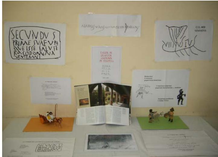
Figura 13. Exposición del Taller de grafitos amorosos