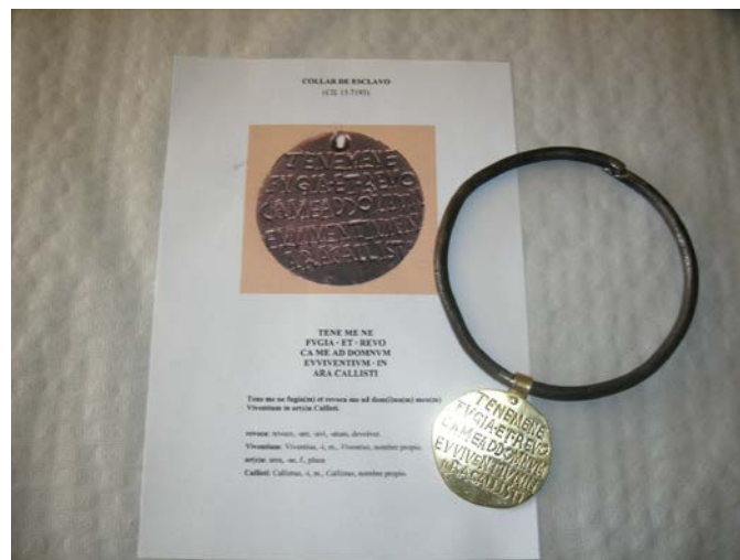
Figura 6. Reproducción de collar de esclavo (CIL 15.7193)

Traducción: Cógeme para que no huya y devuélveme a mi amo Viventio en la plaza de Calisto.