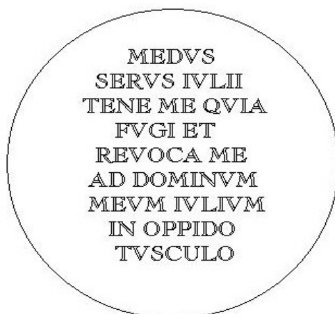
Figura 7. Recreación del collar de esclavo de Medus, personaje de Lingua latina per se illustrata