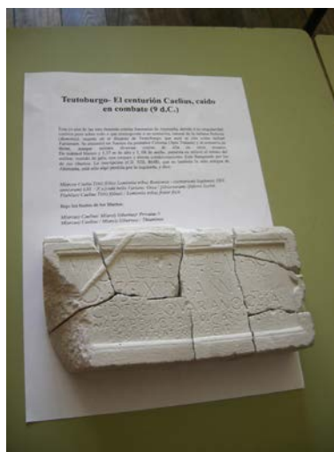
Figura 5. Reproducción en fragmentos del relieve de Marcus Caelius

Marcus Caelius era un centurión de la Legio XVIII Augusta. Su tumba fue encontrada en Castra Vetera, hoy Xanten, en Alemania y estaba hecha en honor de este centurión caído en la batalla del bosque de Teutoburgo en el 9 d.C. Esta pieza es el único testimonio de la matanza de miles de legionarios a manos de los germanos comandados por el legendario Arminio.