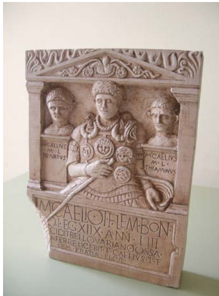
Figura 4. Reproducción del relieve de Marcus Caelius