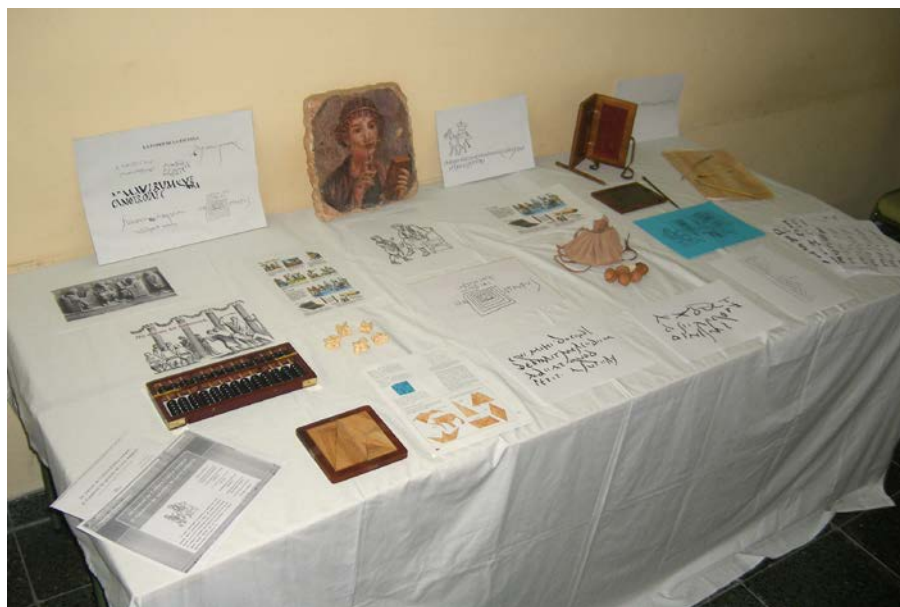
Figura 10. Exposición del Taller de grafitos pompeyanos escolares

«La pared de los gladiadores» puede ir acompañada del uso de objetos de «realia» como las lucernas con motivos gladiatorios o muñecos y espadas de gladiadores 28 (fig. 11). Es posible también relacionarlo con el Taller de gladiadores de Lillus Maximus 29 .