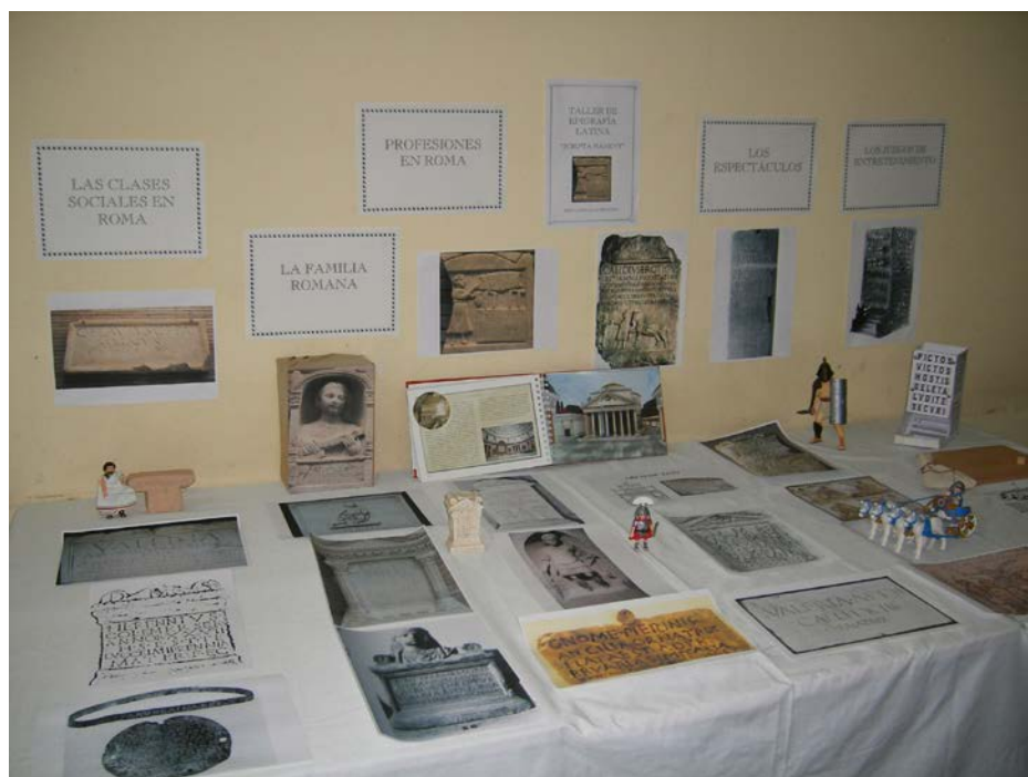
Figura 1. Exposición del Taller de epigrafía latina Scripta manent