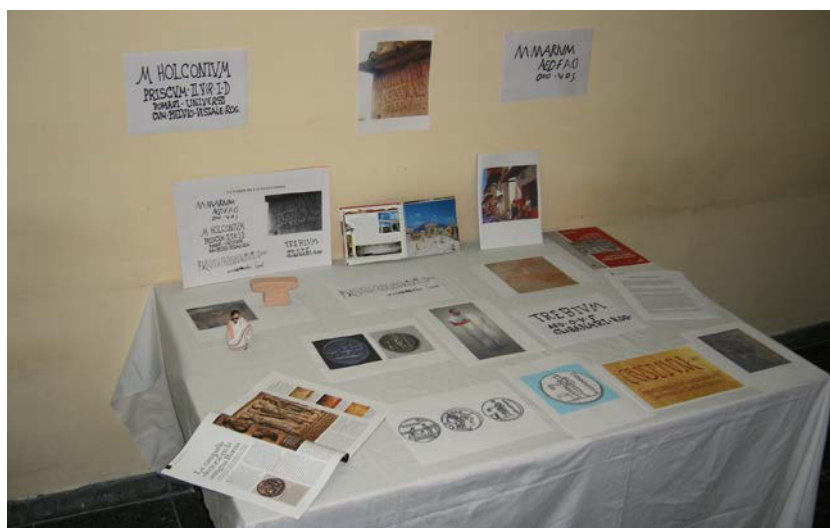
Figura 12. Exposición del Taller de grafitos pompeyanos electorales

El trabajo con «La pared de las elecciones» (fig. 12) puede conectarse con algún periodo electoral que se produzca durante el curso. Igualmente puede usarse con algunos métodos de Latín ya que sobre las elecciones versan los contenidos de la escena 11 Candidati de la Unidad I del Curso de Latín de Cambridge, de la unidad 17 Comitia del Curso de Latín de Oxford y del capítulo 18, Litterae Latinae , del Curso Lingua Latina per se illustrata de Hans Oerberg.